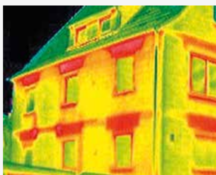
edificio con dispersioni di energia